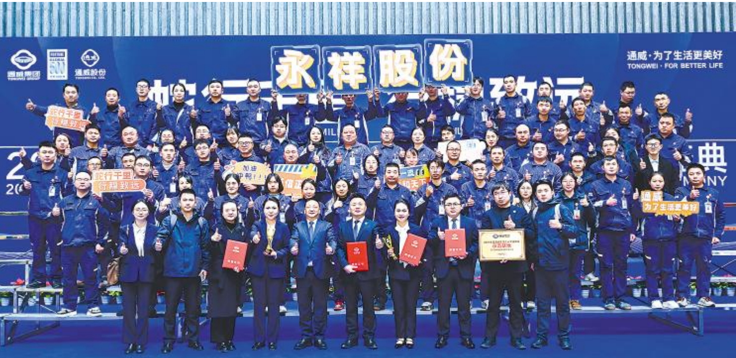
永祥股份精彩亮相 2025 通威集团企业文化主题演讲比赛暨颁奖典礼