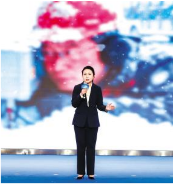
2025 通威集团企业文化主题演讲比赛现场

每天,我都站在这条参观通道。左手,是成吉思汗草原吹来的千年长风;右手,是通威塔林列队的万点星光。 我常常想,我究竟在讲解什么? 直到那个零下 25℃ 的冬夜,我才真正明白——我讲解的,是一封“蛇行千里 行稳致远”的大地情书。而执笔的,是每一个把青春写进风雪的永祥人。