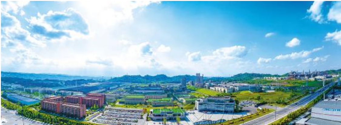
永祥股份乐山基地