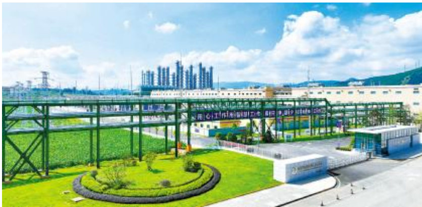
云南通威绿色工厂

产业结构方面，战略性新兴产业加速突破，绿色能源与有色金属相关企业营收合计8263.2亿元，占比51.47%；制造业与服务业融合型企业营收2188.5亿元，占比13.63%，产业融合趋势明显。区域分布方面，滇中地区（昆明市、曲靖市、玉溪市、楚雄彝族自治州）上榜企业