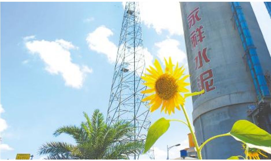
永祥新材料绿色厂区