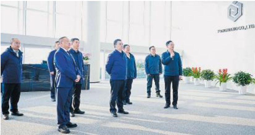
乐山市委书记卢军莅临永祥股份参观调研

的重要支撑。要优化产业链条，持续用力建链强链补链延链，加快布局高端产业，因地制宜发展新质生产力，提升产业体系现代化水平。要挖掘增长潜力，瞄准循环经济领域主导企业，加大招商引资力度，强化服务保障，助力企业更好发展、园区能级提升。要守牢底线红线，常态化开展安全生产隐患排查整治，严格落实各项环保管控措施，为高质量发展奠定坚实基础。