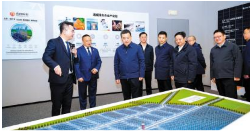
乐山市委书记卢军参观永祥股份数字体验中心

座谈会上，杜总向范喜常务副市长一行的到来表示热烈欢迎，并详细汇报了云南通威的生产经营状况、用工情况、冬季安全管控举措、技改创新进度等。杜总表示，公司在设备检修调试、员