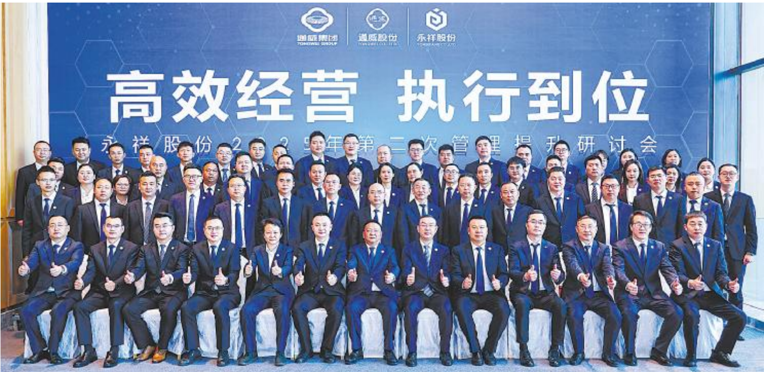
永祥股份成功召开 2025 年第二次管理提升研讨会