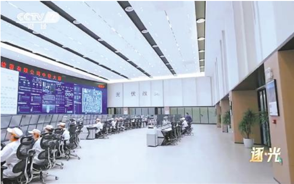
永祥股份重磅登陆央视网首部光伏行业大型纪录片《逐光》