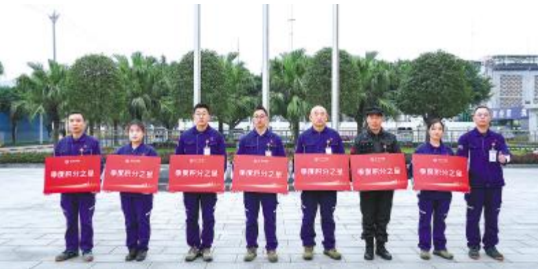
永祥树脂 2025 三季度员工积分表彰仪式现场

2025 年 12 月 22 日,永祥树脂隆重举行 2025 年三季度员工积分表彰仪式。今年以来,永祥树脂积极贯彻落实员工积分活动方案,并结合公司实际,对原有《员工积分管理办法》进行修订,新增季度积分奖品兑换模式,扩大积分表彰范围,引导员工主动作为,全面调动员工工作激情。活动期间,全员积极参与,以“安全稳定、改善提升、团队建设”三大主题为指导,通过完成隐患排查、合理化建议、创新及项目攻关等方式获得积分。 据悉,自员工积分管理实施以