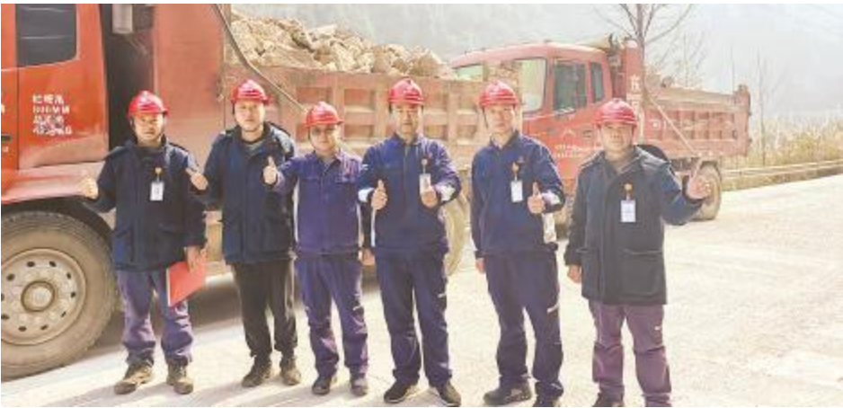
通威硅资源(广元)顺利完成首次工程出矿