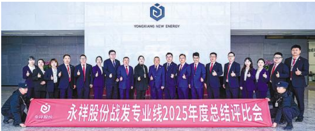
永祥股份战发专业线 2025 年度总结评比会合影留念

未来，永祥股份将围绕“前瞻研判、差异竞争、合规提质、效能升级”四大方向持续发力，同时加强团队建设，搭建人才成长平台，推动个人发展与公司战略深度融合、同频共振，为行业高质量发展注入源源不断的动能。