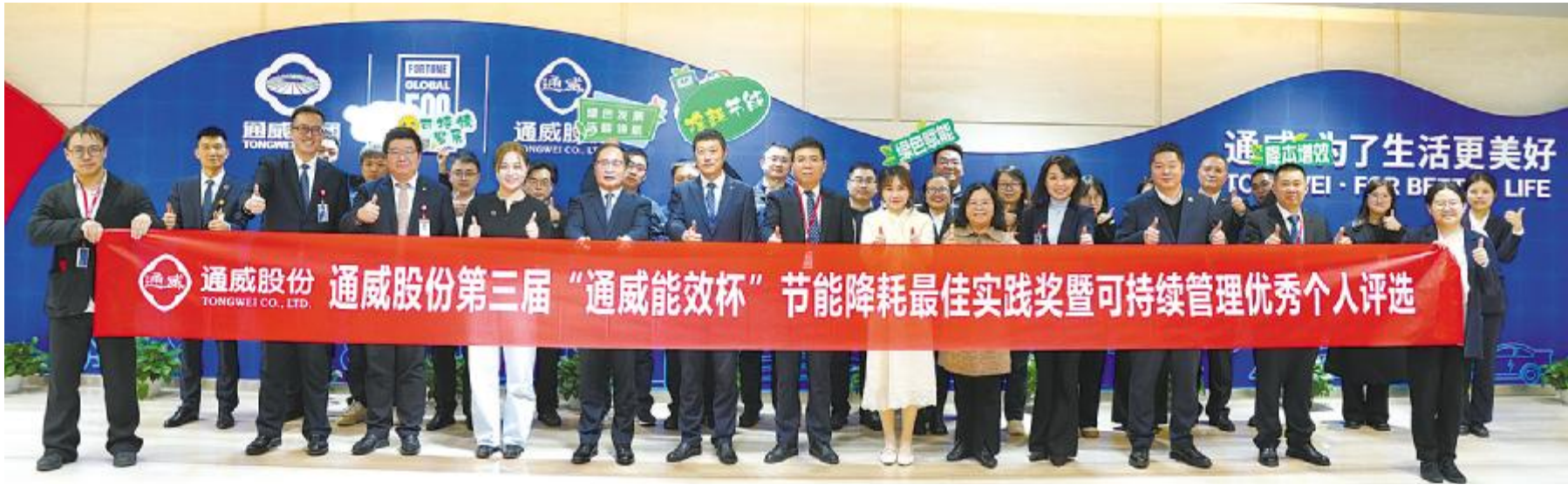
永祥光伏科技在第三届“通威能效杯”评选中斩获佳绩