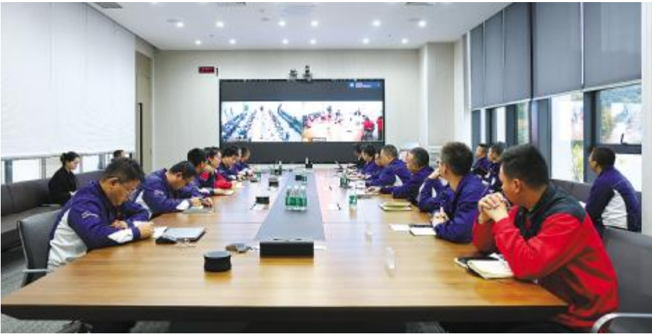
通威绿材(广元)质量督察审核反馈会现场