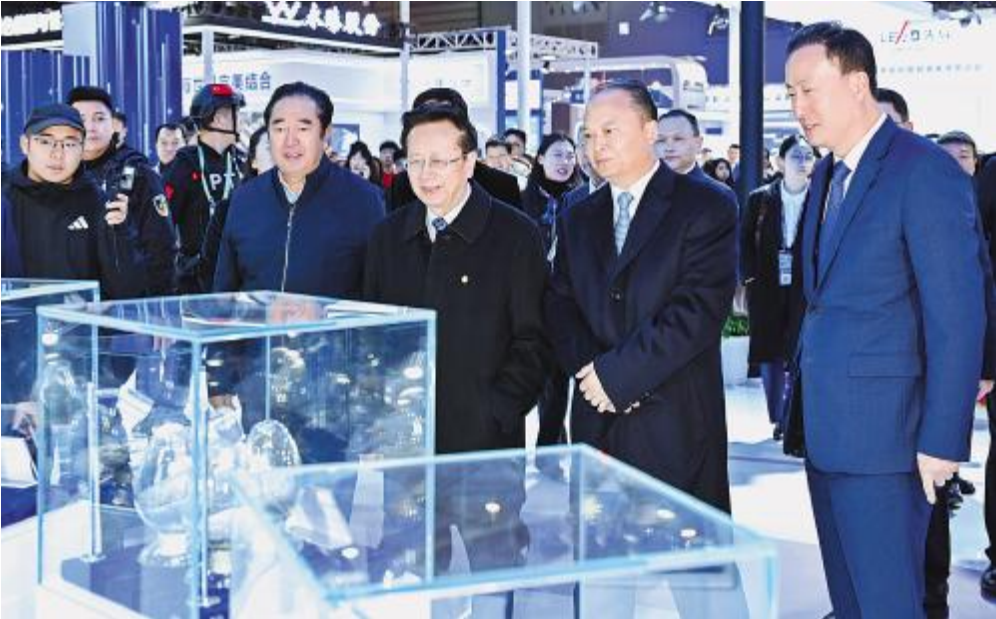
2025 第八届中国国际光伏与储能产业大会期间,领导嘉宾莅临永祥股份展台