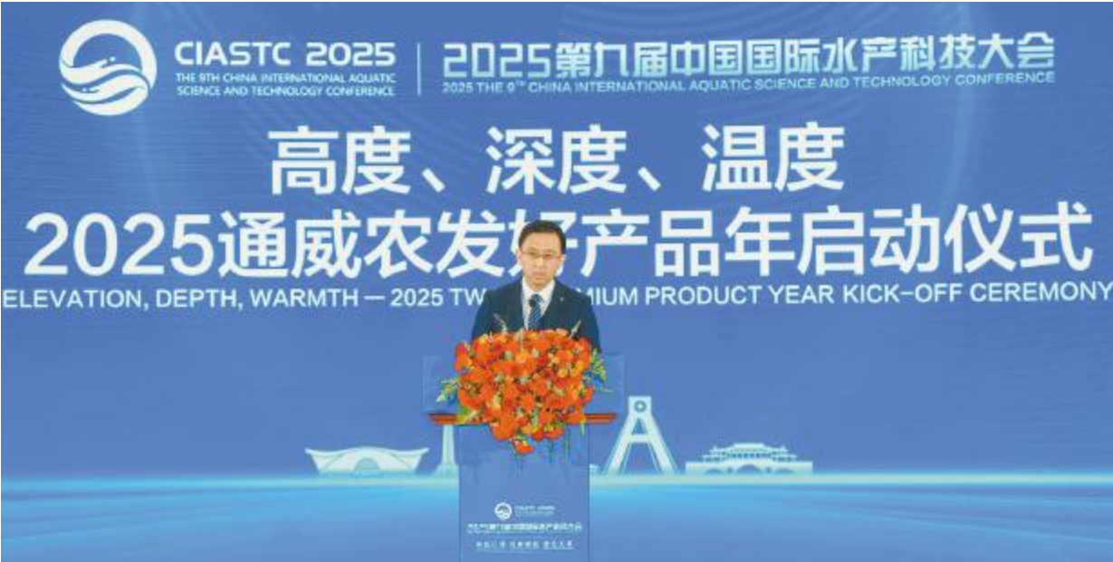
2025 通威农发好产品年启动仪式现场