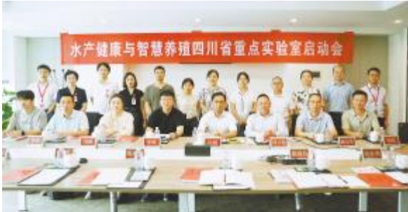
水产健康与智慧养殖四川省重点实验室启动会现场

由通威农业发展有限公司牵头，四川农业大学、四川省农业科学院水产研究所（四川省水产研究所）、四川润兆渔业有限公司联合共建的“水产健康与智慧养殖四川省重点实验室”启动会顺利召开。本次会议旨在紧密围绕国家粮食安全、长江上游生态保护战略及四川省“天府粮仓”建设需求，致力于打造贯通“基础研究—技术突破—产业应用”的创新链条，立足四川、辐射全国，引领淡水养殖产业转型升级，为全球淡水养殖提供“四川方案”和“中国方案”。