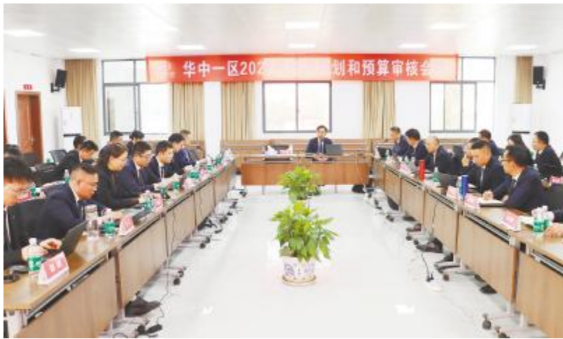
华中一区成功召开 2026 年经营规划和预算审核会议