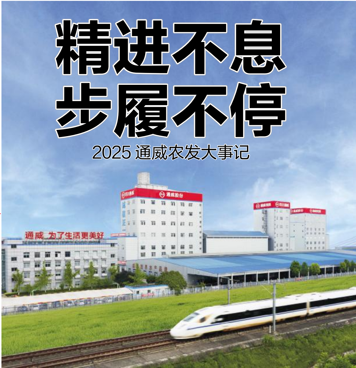
四川通威标准化厂区

由通威农业发展有限公司携手史记生物技术有限公司联合主办的“通威 & 史记猪业‘6 元成本’高峰论坛（东北站）”，在多方期待下盛大启幕。本次论坛以“选择好种猪，搭配好营养”为主题，以实现“6 元时代”为目标，从基因、营养、生产管理、防疫服务、软件支持、产融支撑等方面助力养殖户效益最大化。