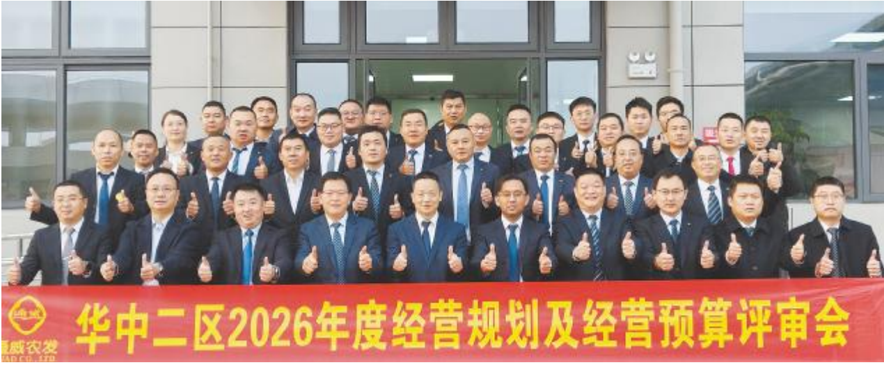
华中二区 2026 年度经营规划及经营预算评审会圆满落幕

作给予肯定,并精准点出汇报中反映的共性问题与薄弱环节。何总强调,各公司要全面梳理评审意见,进一步细化增长路径与盈利管理模式,坚决摒弃单纯价格竞争思维,走价值引领发展之路。通过强化产品创新、精准用户细分,聚焦核心市场深耕细作,破除固有思想壁垒,强化危机意识与责任担当,确保各项经营规划部署落地见效,共同推动华西二区及公司整体高质量发展。